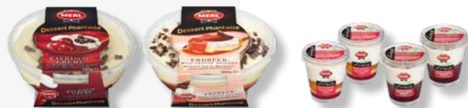
Fotos links: Kuchengenuss einmal anders aus Deutschland: MERL-Kuchendesserts in unterschiedlichen Bechergößen - für den täglichen Genuss

Telefon +49 7522 9705-220 martin.raedler@grunwald-wangen.de