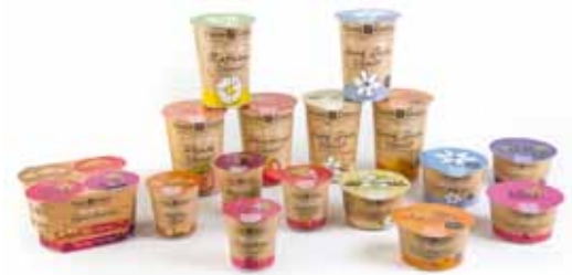
Auswahl aus der breiten Palette hochwertiger Joghurtprodukte