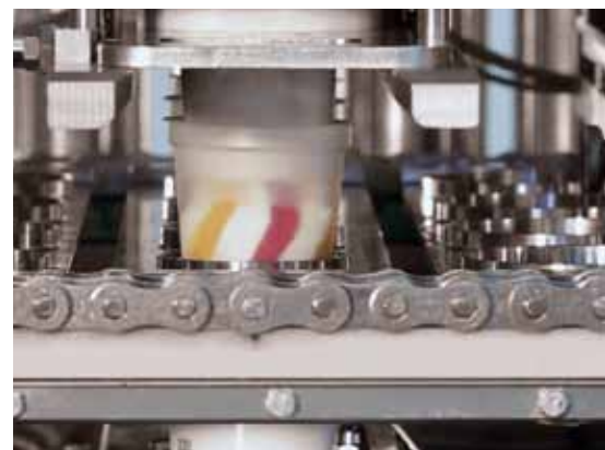
faszinierende Abfüllmöglichkeit „Swirl“- und „Side-by-Side“-Technik