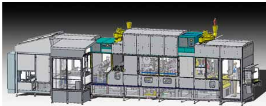
Längsläufer FOODLINER 20.000 Ultraclean