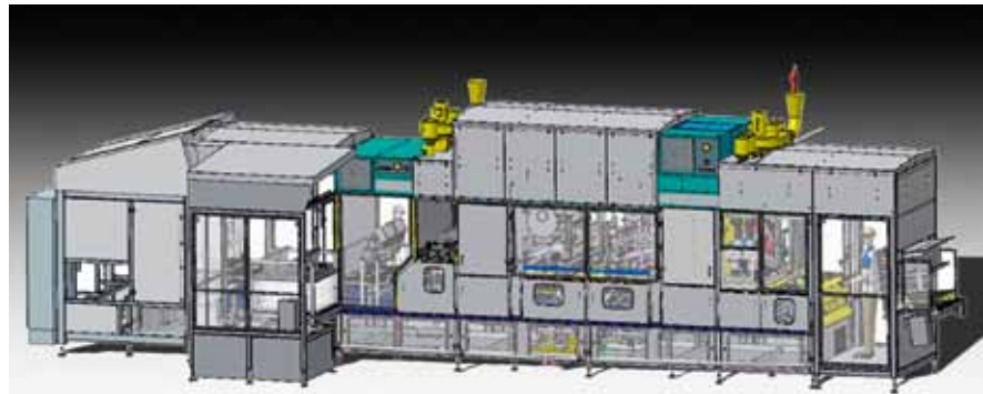
Längsläufer FOODLINER 20.000 Ultraclean