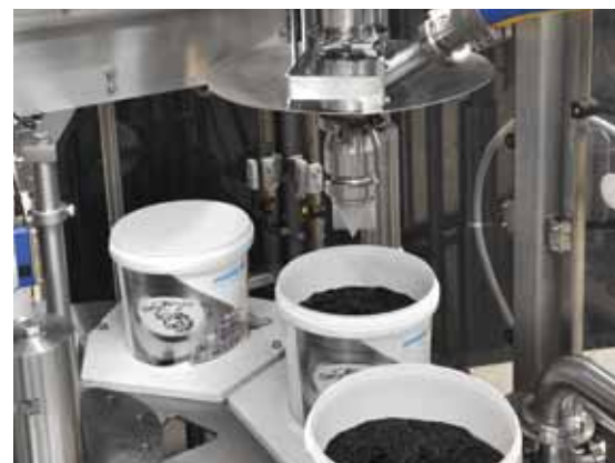
Dosierstation der GRUNWALD-HITPAC XL